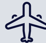
Reizen en logies